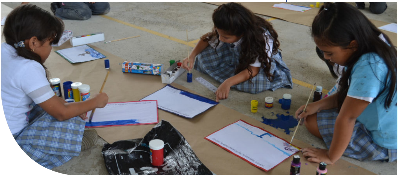
Concurso de dibujo en el Colegio Naval de Manzanillo en el marco de la celebración del Día Mundial de los Océanos 2015.

Mientras que en el Colegio Naval de Manzanillo se desarrolló un concurso de dibujo por categorías donde participaron 134 niños entre los 4 y 12 años de edad.