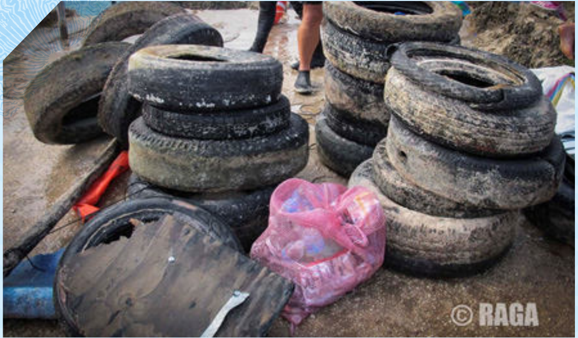
Imagen 6. Foto de las llantas y residuos sólidos sumergidos extraídos del fondo marino en West View, en la jornada de Colombia Limpia el 6 de Junio de 2016 en San Andrés Isla.

servicio, los cuales se animaron a colaborar en las labores realizadas, y a los cuales se les explicó la importancia de no arrojar basuras al mar, y se les participó de todas las labores realizadas. Se entregó en el lugar manillas, termos y bolsas de tela a los participantes, turistas y personal del lugar, recordándoles la importancia de mantener limpios nuestros océanos, y realizar prácticas amigables con el medio ambiente.