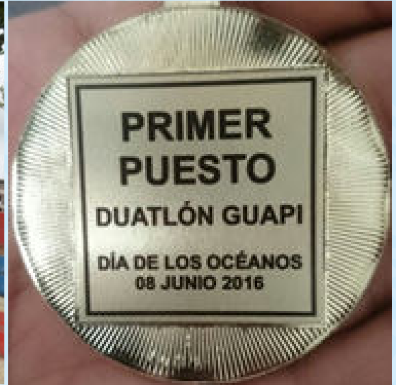
Duatlón municipal en el marco de la Celebración del Día Mundial de los Océanos. Guapí 2016.

Otra de las actividades desarrolladas fue de limpieza y descontaminación en la playa del Obregón, contribuyendo a mejorar el aspecto de esta, ecosistema que se considera de vital importancia, y últimamente se ha visto afectado debido a que la corriente del Río Guapi está arrastrando gran parte de sus basuras hacia este sector perjudicando la pesca artesanal en la bocana del río.