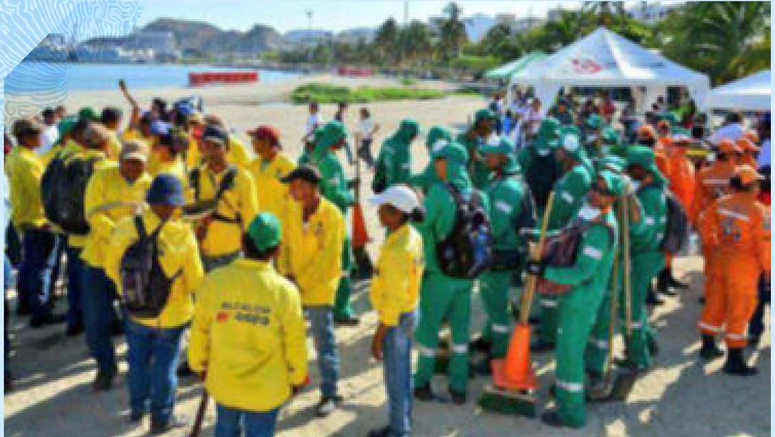
Limpeza de playa en la Bahía de Santa Marta.

Así mismo se envió un mensaje claro a la población a través de los medios de comunicación