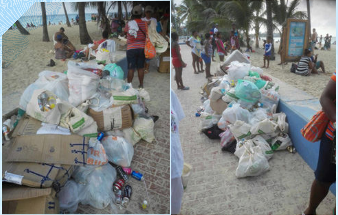
Imagen 3. Jornada de limpieza en Sprat Bight, donde se realizó la limpieza de playas en la jornada de Colombia Limpia del 6 de Junio de 2016 en San Andrés Isla.