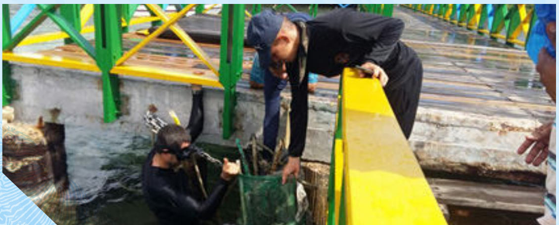
Limpieza de las áreas costeras y submarinas del sector Santa Isabel

El 09 de junio se realizó una limpieza submarina en el sector centro de la isla, en la cual todos los miembros del COMUEDAN se hicieron partícipes (CORALINA, PNN MC BEEN LAGOON, PNA 21, EGPROV, ICBF, ALCALDIA MUNICIPAL, IEMI, COLEGIO JUNIN, CAPITANIA DE PUERTO, ENTRE OTRAS). Para el desarrollo de esta actividad se contó con el apoyo de las diferentes tiendas y supermercados de la isla que se encuentran comprometidos con el medio ambiente y quienes colaboraron con sacos y bolsas de basuras, al igual que bebidas y refrigerios para los participantes.