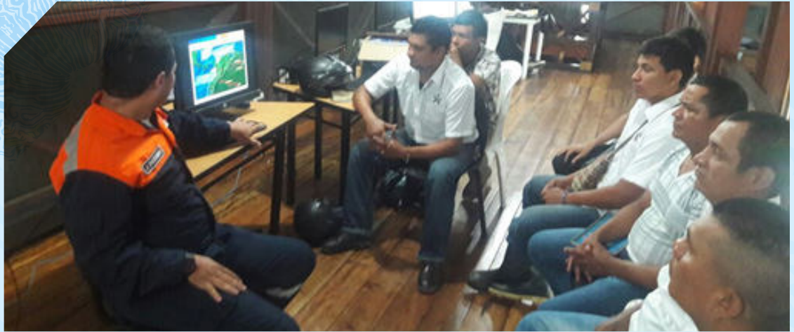
Charla dirigida a los estudiantes del curso de formación técnica del SENA Regional Leticia.

En cuanto a la Capitanía de Puerto de Leticia se realizó una charla de para generar conciencia en los estudiantes del curso de formación técnica del SENA Regional Leticia, la cual estuvo diseñada para resaltar la importancia y cuidado que la población debe tener con los océanos y ríos con el fin de conservar estos importantes ecosistemas que dan sustento a la humanidad. Así mismo se proyectó el video elaborado en ocasión del Día Mundial de los Océanos. La charla tuvo gran acogida entre los estudiantes quienes se mostraron a favor de este tipo de celebraciones que resalten y permitan conocer un poco más de nuestros océanos y se comprometieron a compartir esta enseñanza con sus familias.