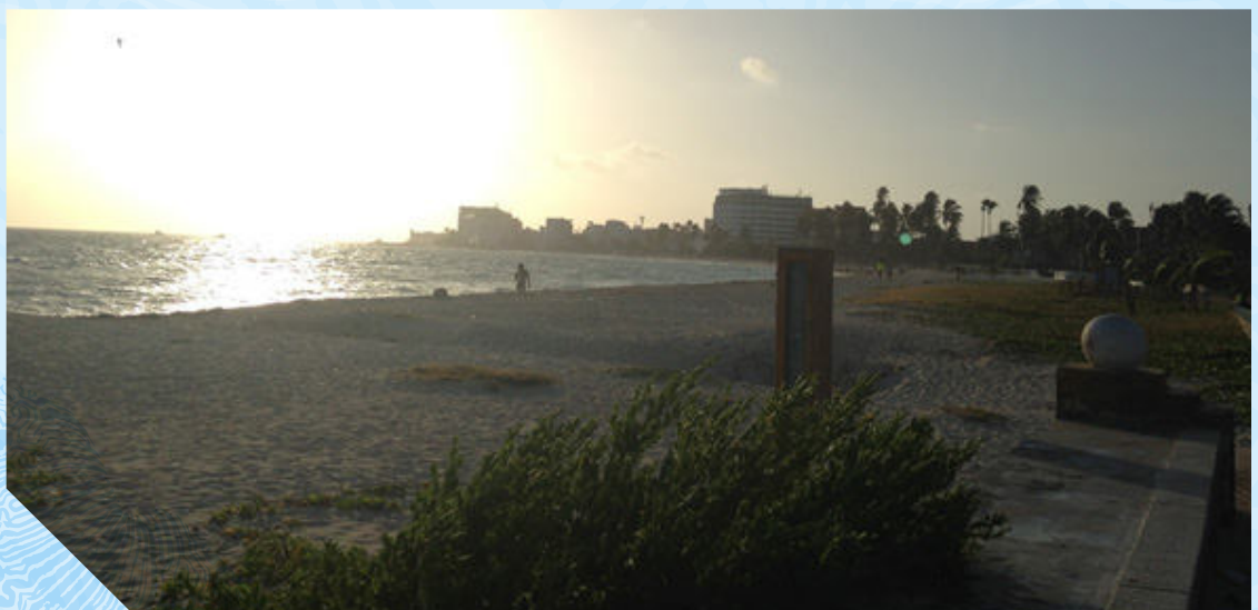
Imagen 1. Foto de Sprat Bight donde se realizó la limpieza de playas en la jornada de Colombia Limpia del 6 de Junio de 2016 en San Andrés Isla

El evento tenía como objetivo sensibilizar a la comunidad, turistas y viajeros, así como a los prestadores de servicios turísticos, acerca de la responsabilidad y compromiso para el manejo sostenible de los recursos naturales y culturales en los lugares que se visitan en el territorio nacional, además de promover prácticas responsables relacionadas con el manejo de basuras y la disposición adecuada de las mismas. Las actividades de la campaña se han realizado en diversos destinos con importantes resultados en las jornadas de limpieza y recolección de basuras que como parte de la estrategia de sensibilización, motivan el cuidado del medio ambiente de los lugares frecuentados por los turistas. En esta ocasión la jornada de Colombia Limpia se llevó a cabo en dos puntos estratégicos de la isla: la playa de Sprat Bight (Imagen 1) y el fondo marino del Ecoparque West View (Imagen 2).