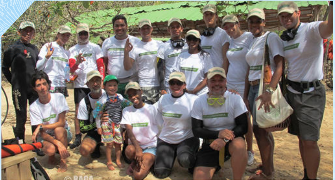
Imagen 4. Grupo de buzos de la Iniciativa Bajo Tranquilo que realizaron limpieza de fondos marinos en West View, en la jornada de Colombia Limpia del 6 de Junio de 2016 en San Andrés Isla.