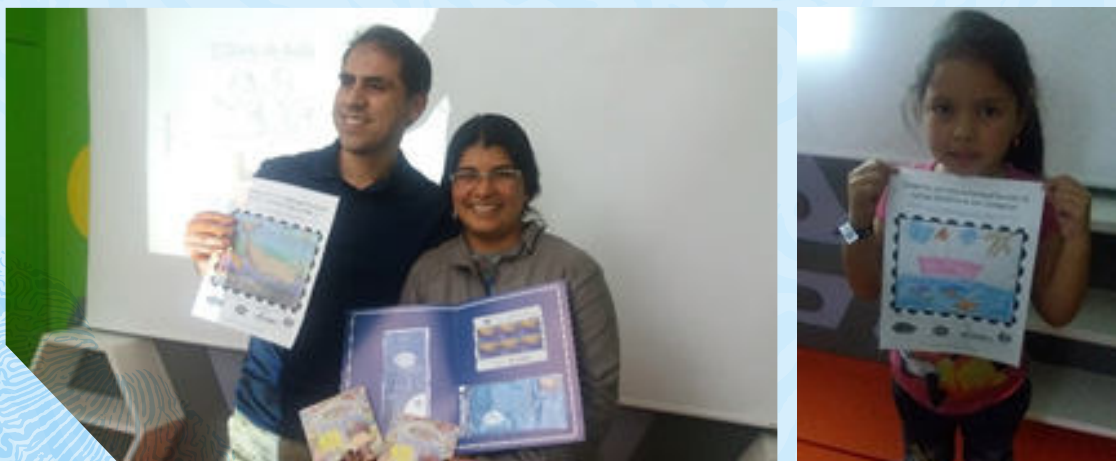
Creación de estampillas sobre el tema "Protección de nuestros Océanos"

En el mismo escenario, en alianza con la Asociación de Filatelia y Numismática de Colombia se invitó a grupos familiares para que en conjunto desarrollaran una estampilla que tuviera como temática el cuidado y la protección de los océanos.