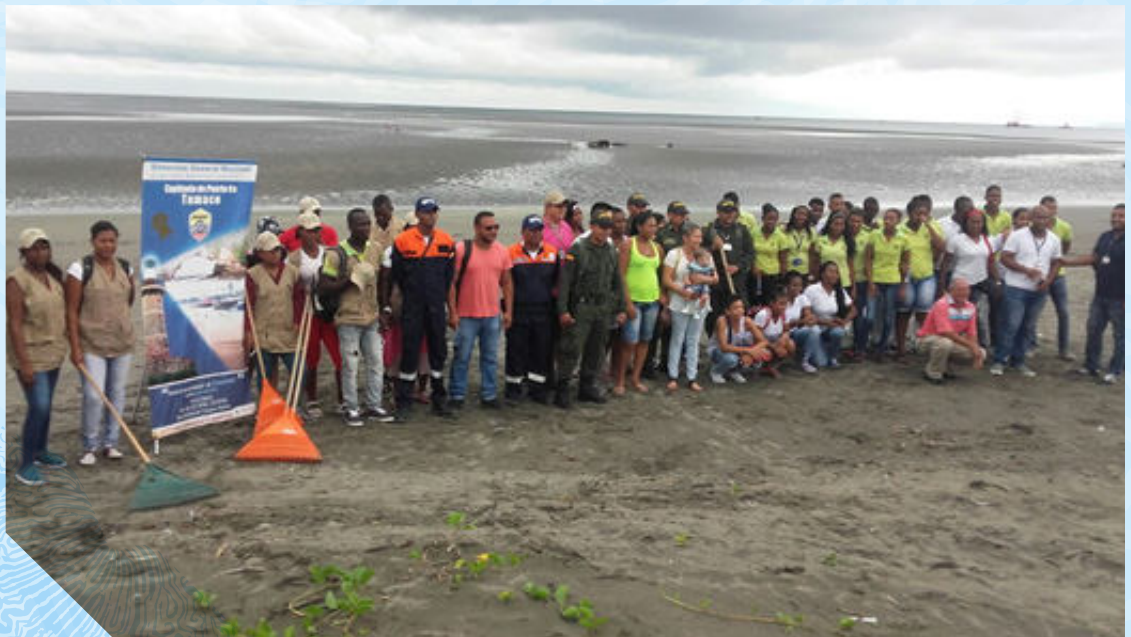
Jornada de limpieza en la playa del Morro, Tumaco.

La Capitanía de Puerto de Buenaventura, realizó actividades con el fin de generar conciencia en la población de jóvenes, estas estuvieron enfocadas en resaltar la necesidad de cuidar los océanos como pieza principal del futuro del mundo. El mensaje fue que "todos tienen un grano de arena por aportar". La jornada terminó con un concurso de dibujo con niños de cuarto grado de la Institución Educativa San Rafael de Buenaventura.