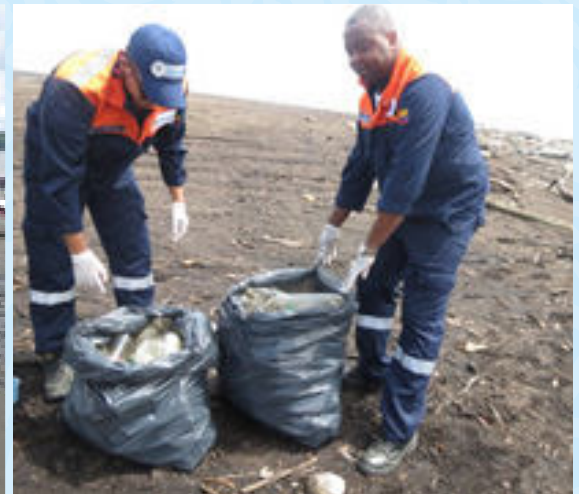
Duatlón municipal en el marco de la Celebración del Día Mundial de los Océanos. Guapí 2016.