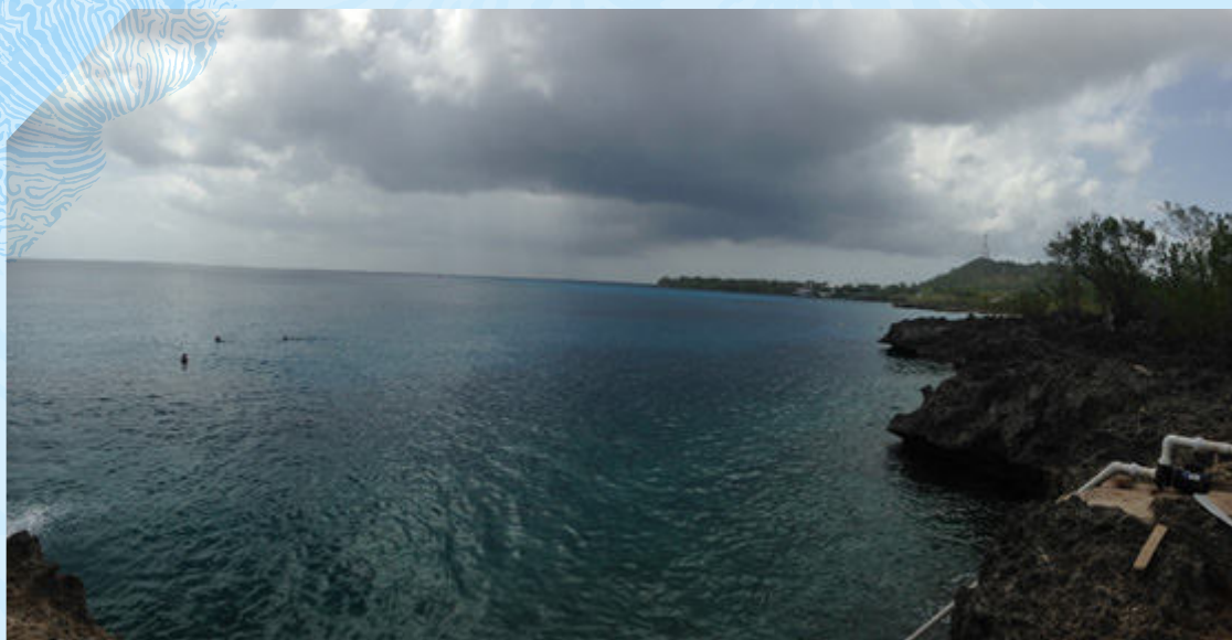
Imagen 2. Foto de West View donde se realizó la limpieza de fondos marinos en la jornada de Colombia Limpia del 6 de Junio de 2016 en San Andrés Isla

Spat Bight es una de las principales playas de la isla de San Andrés, ubicada en la punta norte de la isla es la única playa en la zona urbana de San Andrés. Por su ubicación es la playa que mayor flujo de personas tiene diariamente, por lo que a diario se presentan cientos de personas, muchas de las cuales dejan sus residuos en la playa. Ante esta problemática, y teniendo en cuenta su importancia turística Spar Bight fue seleccionada como punto de limpieza para la jornada de Colombia Limpia. En dicha jornada se realizó una limpieza de la playa, en la cual se involucraron a turistas, residentes y prestadores de servicio de la zona para que fueran ellos mismos quienes realizaran la limpieza de la playa. Personal identificado con las camisetas de Colombia Limpia repartieron bolsas de tela a las personas en la playa, mientras se explicaba la importancia de mantener las playas limpias. Se motivaron a las personas para que recogieran en las basuras y las entregaran en un punto determinado, premiando a quienes las llevaran con termos, gorras, manillas y kits de colorear identificados con el logo #ColombiaLimpia. Por medio de esta estrategia se logró involucrar a la comunidad de la zona y se realizó exitosamente la jornada de limpieza en la playa de Sprat Bight, recogiendo latas, botellas, pitillos y cajas, entre otros, para un total de más de 150kg de basura colectada (Imagen 3).