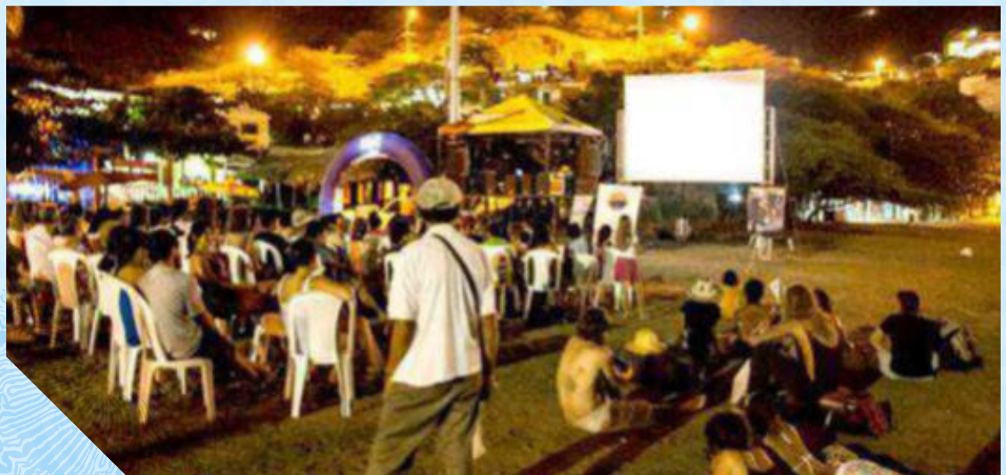
Festival de Cine al Mar. De Santa Marta, Rodadero y Taganga.

Otra de las ciudades que se vinculó a la celebración fue Riohacha, desde esta parte del país se fomentó una cultura de respeto y protección de los recursos marinos costeros mediante una capacitación a los aprendices del Servicio Nacional de Aprendizaje SENA.