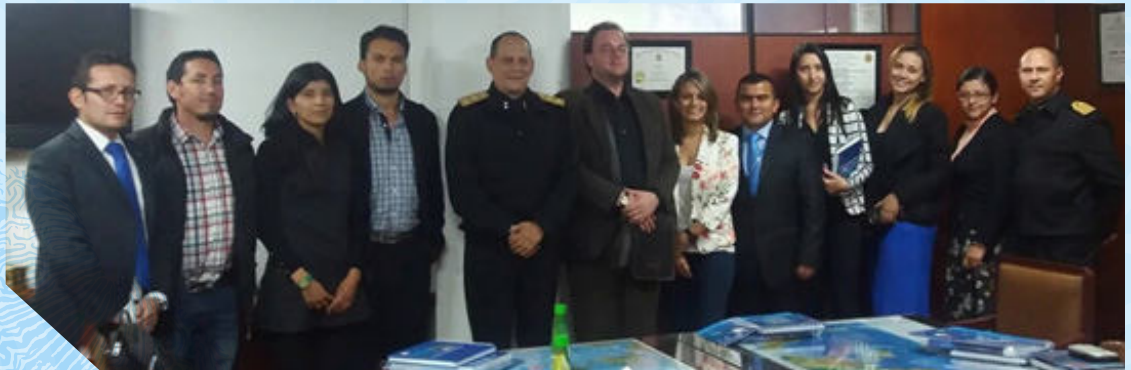
Primera reunión preparatoria marzo 2016. Sala SECCO.

Los actores que participaron en esta versión fueron: Dirección General Marítima, Armada Nacional de Colombia, Fundación Marviva, Parques Nacionales Naturales de Colombia, WWF, Conservación Internacional Colombia, Ministerio de Ambiente y Desarrollo Sostenible, Museo de los Niños, Procolombia, Instituto de Investigaciones Marinas y Costeras “José Benito Vives de Andrés” INVEMAR, Universidad de Antioquia sede Turbo, Universidad del Valle, Fundación Pavco, Servicios Postales Nacionales 472, Asociación de Filatelia y Numismática de Colombia, CORPONARIÑO, Unicentro Cali, Secretaría de Turismo de la Alcaldía de Tumaco, Policía Nacional, SENA, Institución Educativa San Rafael de Buenaventura, Escuela Naval Suboficiales de Barranquilla, Guardacostas de Barranquilla, Universidad del Magdalena, Alcaldía de Santa Marta, Defensa Civil, Drummond, CRC, IAAP, BAFIM 42, Alcaldía Municipal de Guapi, AUNAP, Policía Nacional, Cruz Roja, CORALINA, PNN MC BEEN LAGOON, PNA 21, EGPROV, ICBF, Alcaldía Municipal de Providencia, IEMI, Colegio Junín, Ministerio de Industria y Comercio y Fontur.