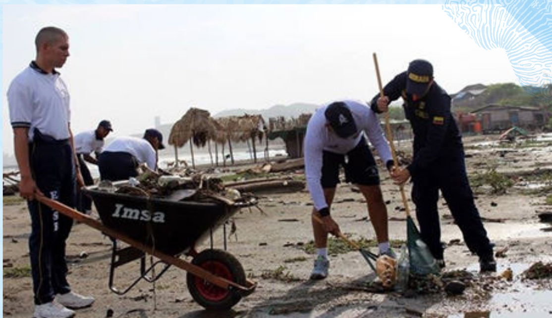
Limpieza de playas en Puerto Colombia

Además el 07 de junio de 2016, se asistió al foro liderado por la Universidad del Magdalena, donde se realizaron presentaciones sobre la expedición científica de Colombia a la Antártida, el efecto del calentamiento global sobre los océanos y el cambio climático entre otros.