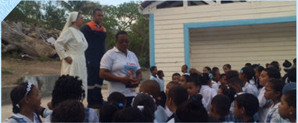
Duatlón municipal en el marco de la Celebración del Día Mundial de los Océanos. Guapí 2016.

Se sumó también a la celebración la Capitanía de Puerto de Providencia, el día jueves 09 de junio de 2016, se realizaron charlas de sensibilización y concientización en las instituciones educativas de la Isla con el enfoque netamente de prevención en la contaminación marina.