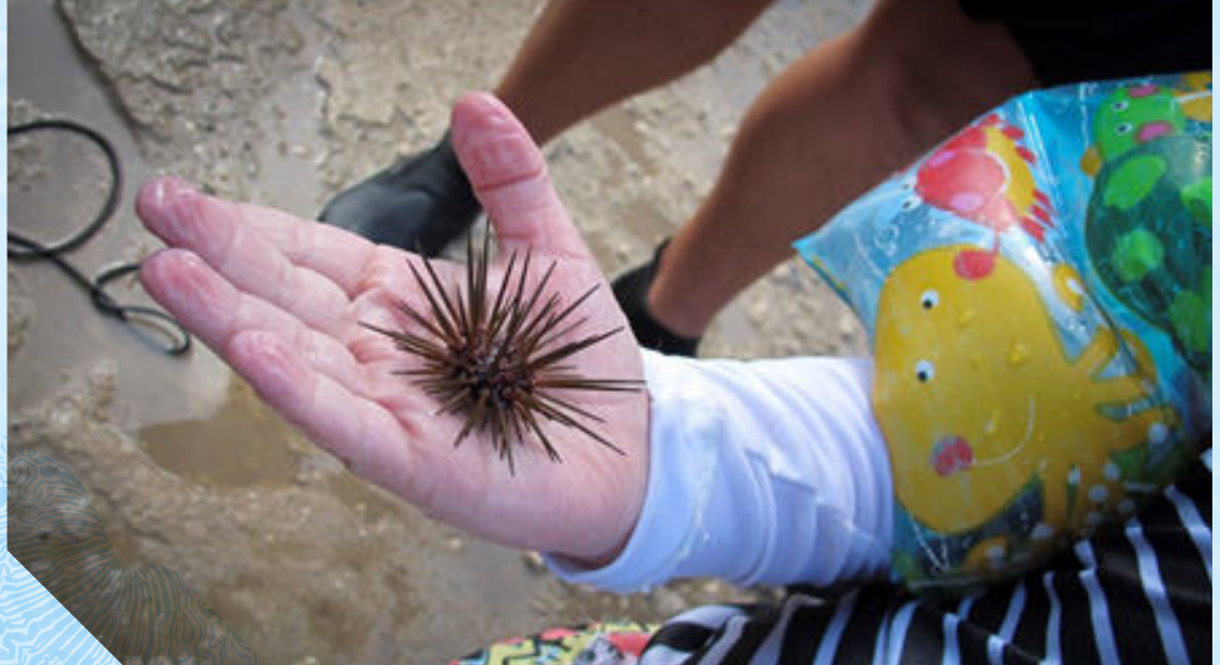
Imagen 5. Foto de un erizo encontrado asociado a los residuos sólidos sumergidos extraídos del fondo marino en West View, en la jornada de Colombia Limpia el 6 de Junio de 2016 en San Andrés Isla.