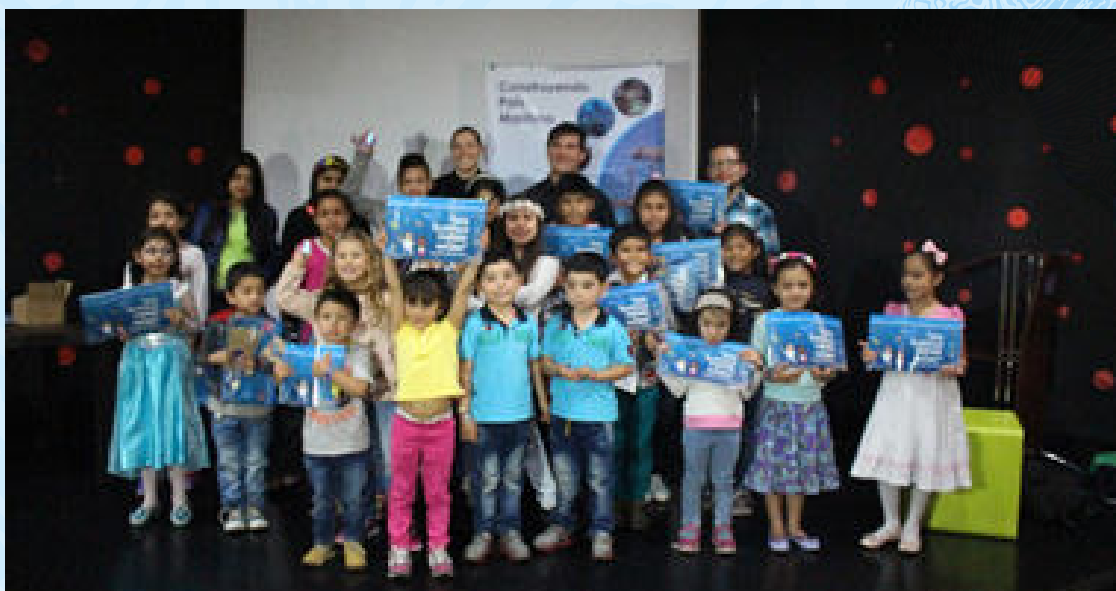
Exposiciones del panel sobre la salud del océano

Desde Bogotá, la Comisión desarrolló diferentes actividades que estuvieron enfocadas en vincular a la capital del país en los temas marítimos y costeros, en ese sentido en alianza con el Museo de los Niños se realizó el lanzamiento de la cartilla infantil para colorear "Una Aventura Llamada Océano".