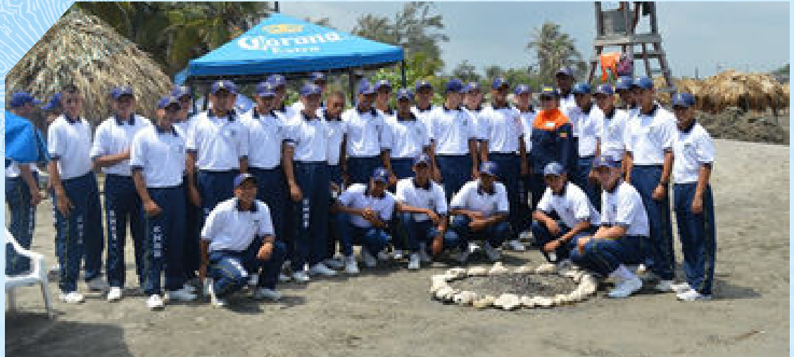
El Colegio Simón Bolívar de Puerto Colombia, celebró el Día Mundial de los Océanos 2016.

Finalmente las actividades organizadas y/o lideradas por la Capitanía de Puerto de Santa Marta el 18 de junio efectuó la limpieza en la playa de la Bahía de Santa Marta, con la participación de las Autoridades Ambientales, Alcaldía, la Defensa Civil, SENA, Drummond y la comunidad samaria en general.