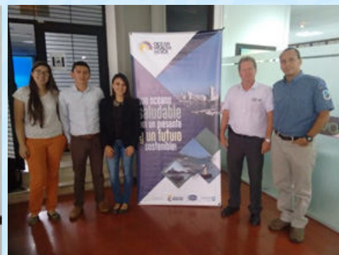
Exposiciones del panel sobre la salud del océano.